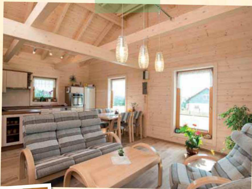
Jemné nabělení dřeva prosvětluje interiér, současně zamezuje do budoucna přirozenému ztmavnutí dřeva a nedostatku světla v místnostech