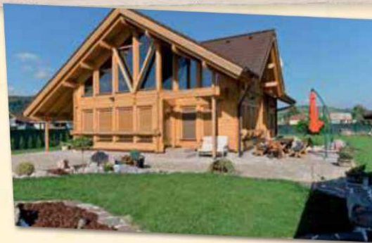
Velké přesahy střechy částečně zabraňují letnímu přehřívání Interiéru prostřednictvím prosklených ploch a zároveň chrání dům před povětrnostními vlivy