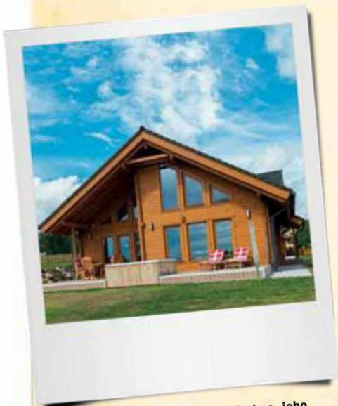
Dům je umístěn na pokraji obce, jeho okolí tvoří rozlehlá zahrada a krásné louky. Velké prosklené plochy se zde přímo nabízejí jako optická spojnice Interiéru s okolní přírodou